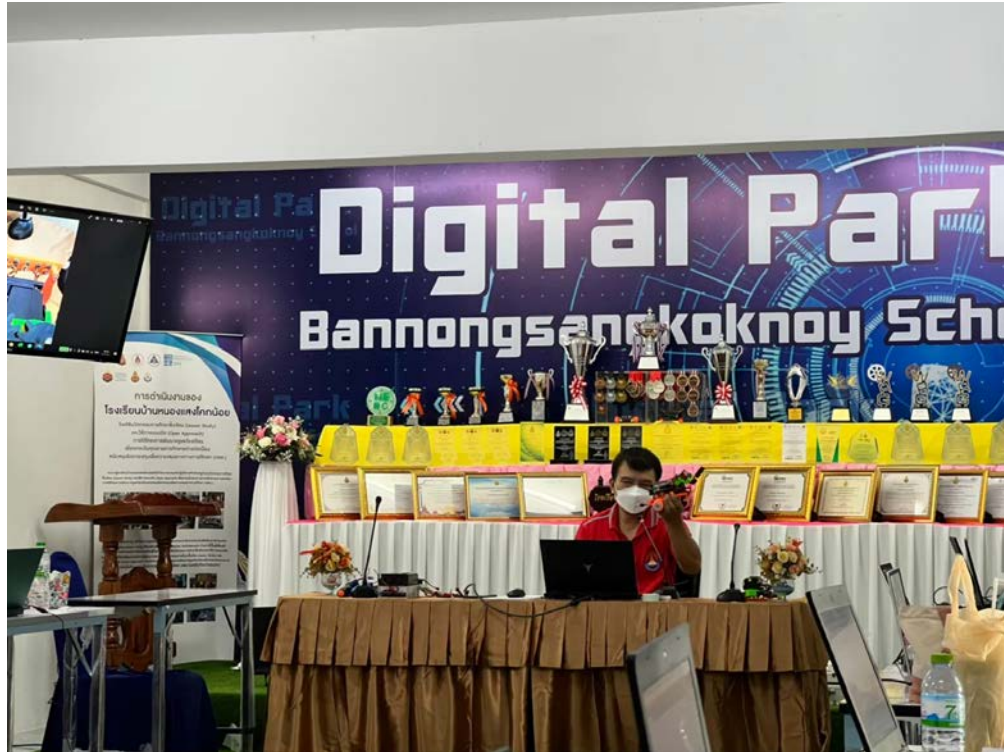
อบรมพัฒนาบุคลากร