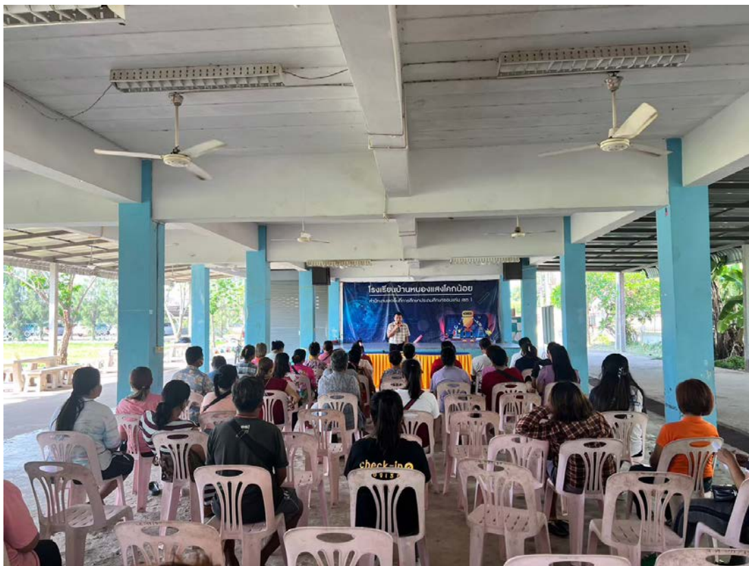
ประชุมผู้ปกครองปีการศึกษา 2565