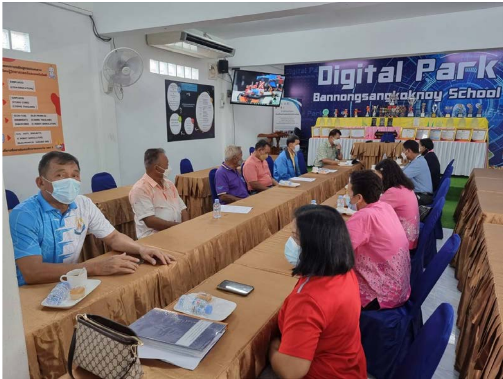
ประชุมคณะกรรมการสถานศึกษาโรงเรียนบ้านหนองแสงโคกน้อย