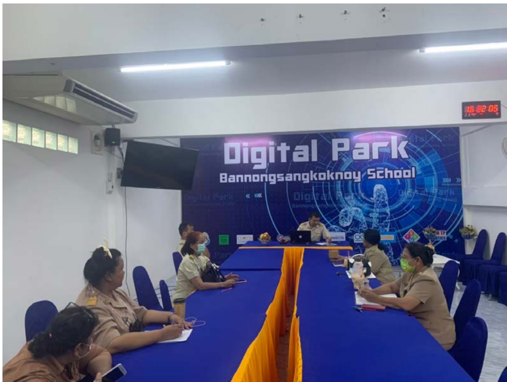
ประชุมข้าราชการครูและบุคลากรทางการศึกษาโรงเรียนบ้านหนองแสงโคกน้อย