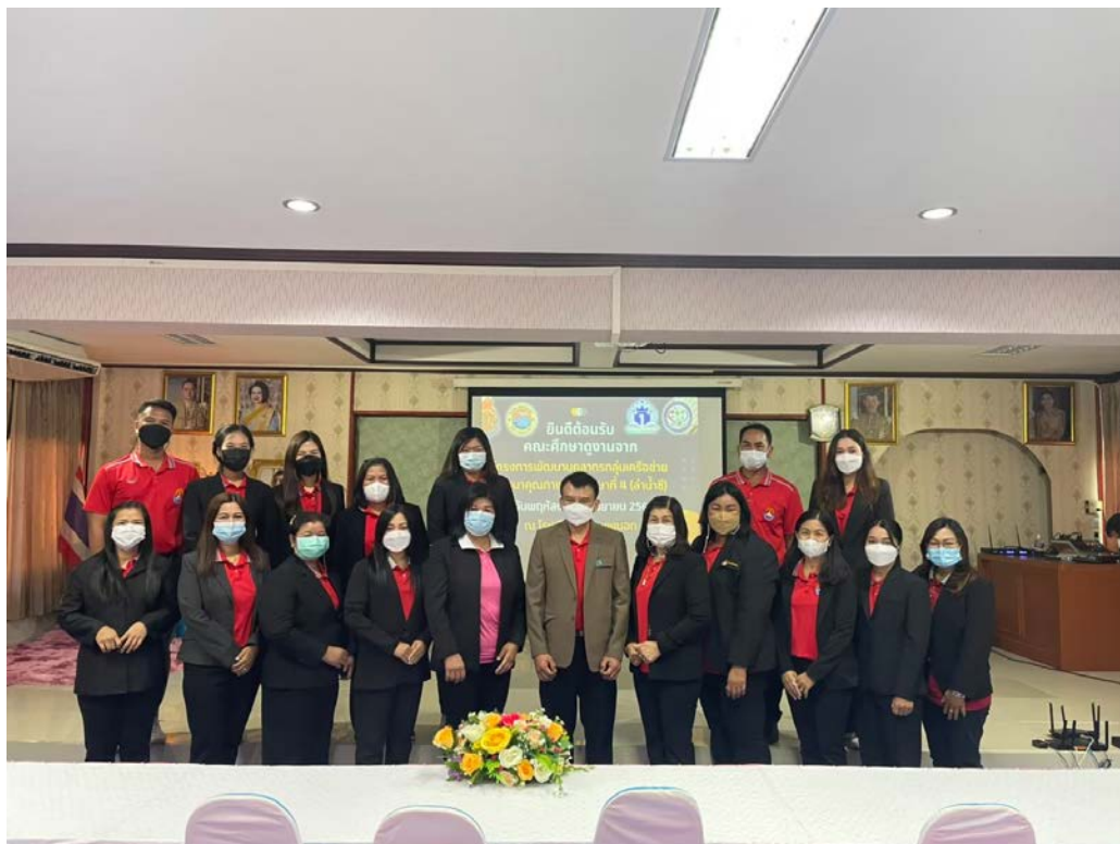
ศึกษาดูงานที่โรงเรียนวัดตะพงนอก จังหวัดระยอง