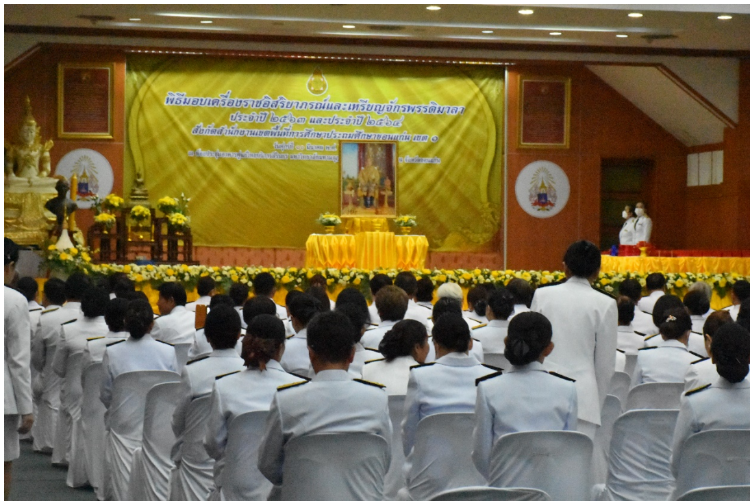
พิธีมอบเครื่องราชอิสริยาภรณ์ชั้นต่ำกว่าสายสะพายและเหรียญจักรพรรดิมาลา ประจำปี ๒๕๖๓ และประจำปี ๒๕๖๔