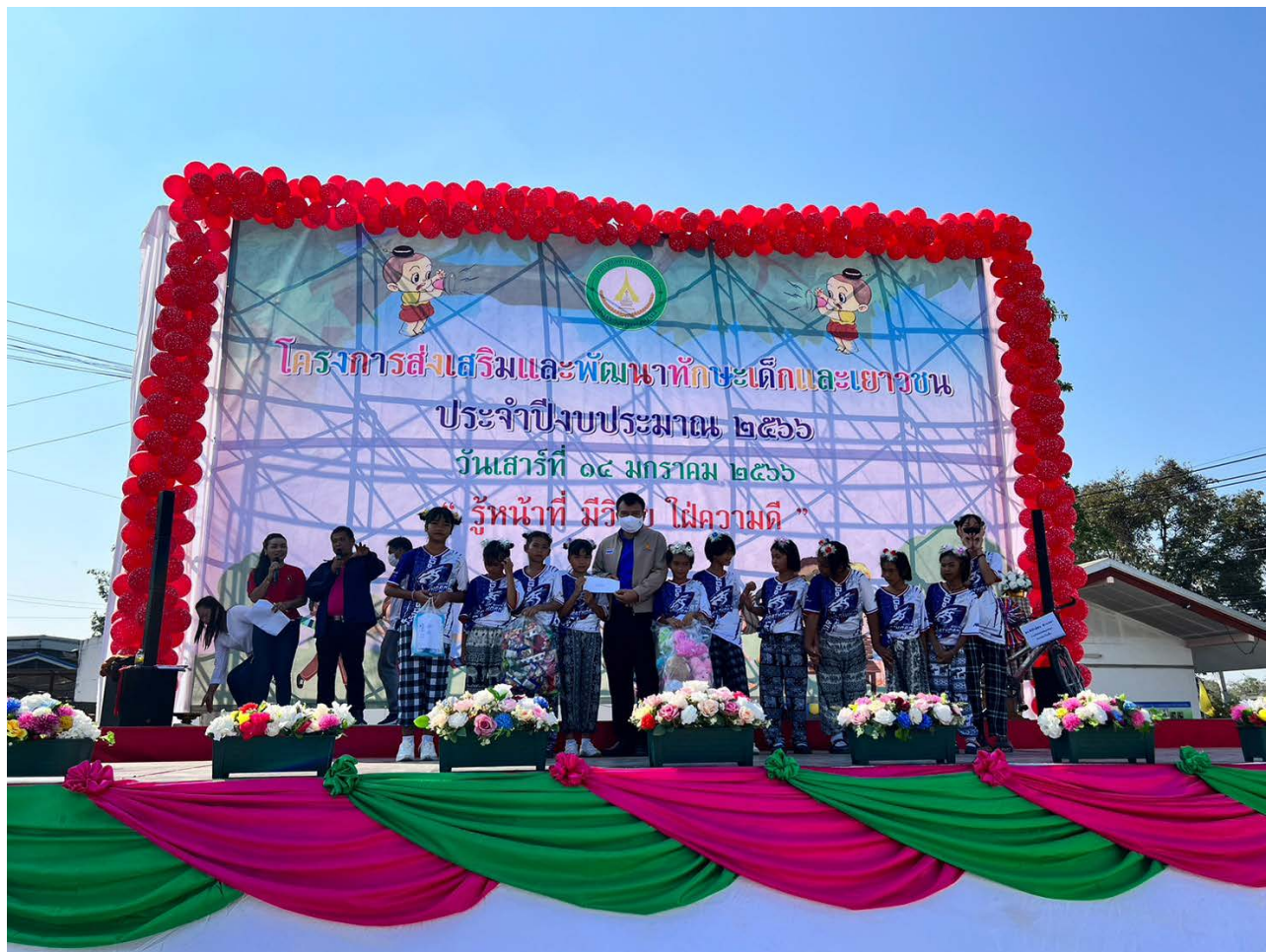
กิจกรรมวันเด็กแห่งชาติ ร่วมกับเทศบาลตำบลพระลับ